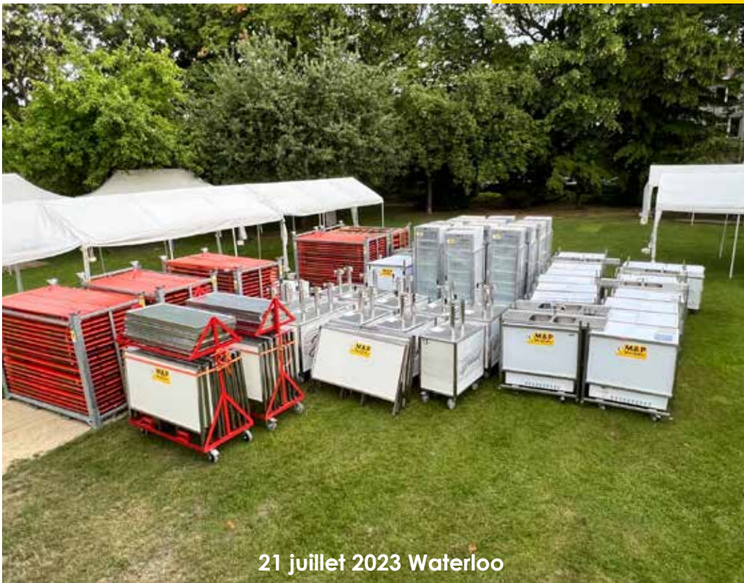
21 juillet 2023 Waterloo