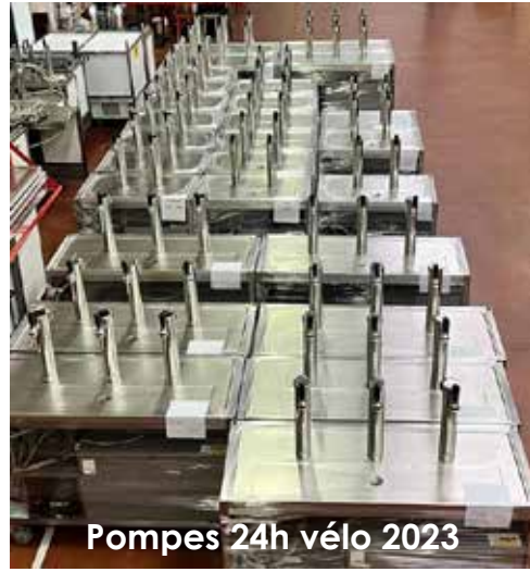
Pompes 24h vélo 2023