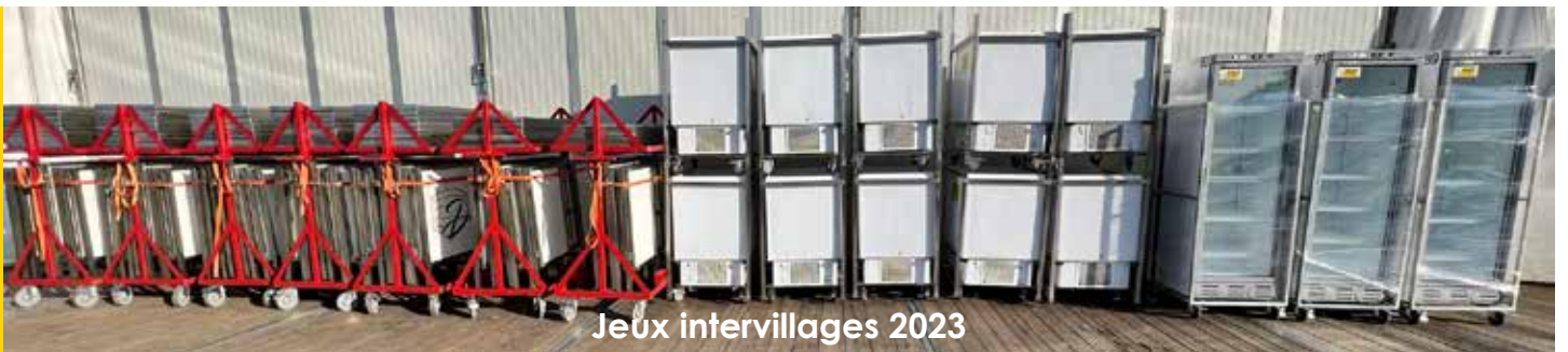
Jeux intervillages 2023