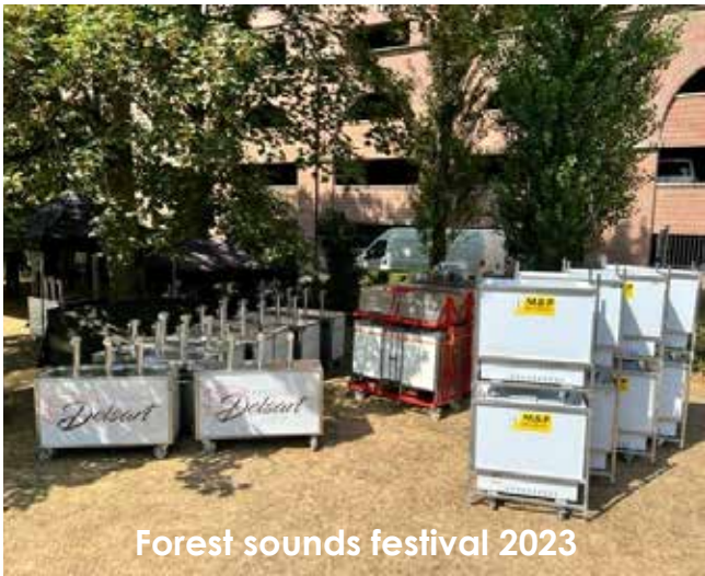
Forest sounds festival 2023