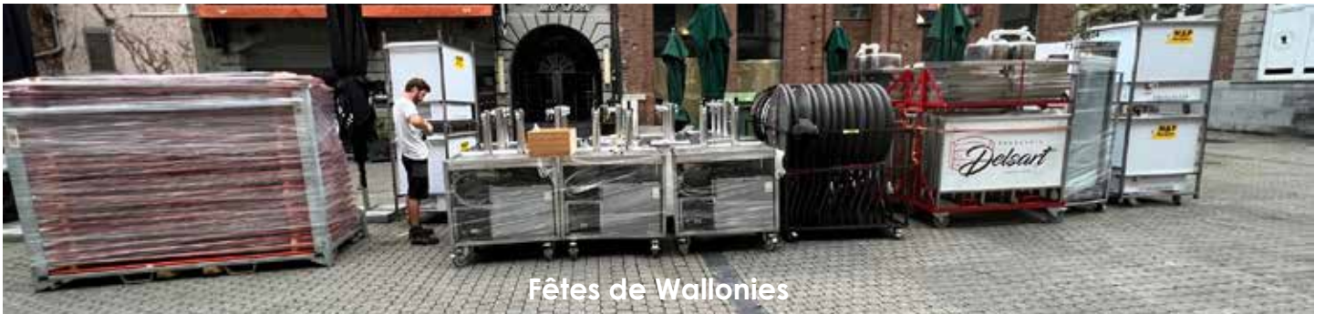
Fêtes de Wallonies